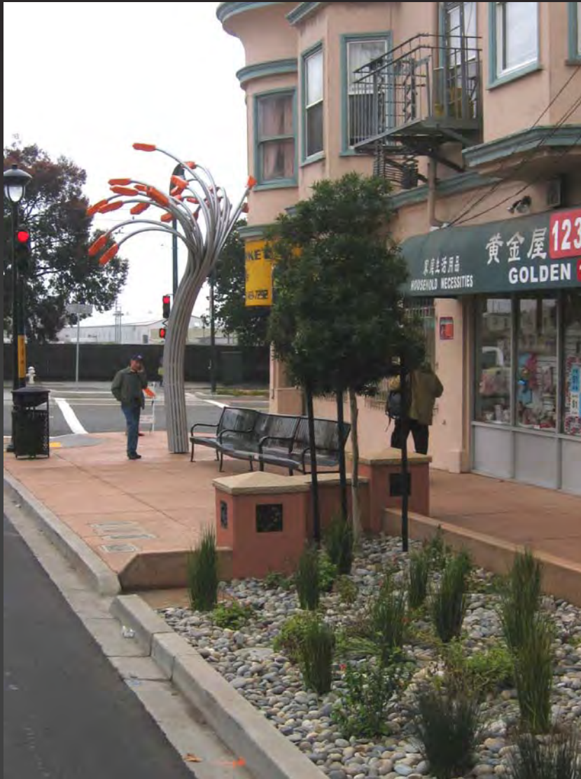
CHINATOWN BROADWAY STREET DESIGN