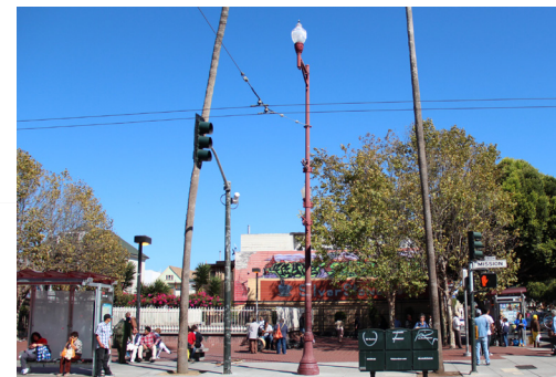
Pole Mounted Farola

Cobra Head and Pedestrian streetlights are the two main light types found on Mission Street. Cobra Head lights are very utilitarian and excellent for night visibility, especially at intersections. Pedestrian lights are more useful at a pedestrian scale and are often associated to well-developed public spaces designed for human activities. During our field surveys we noticed other lighting sources that are not recorded in the PUC databases: active storefronts lights, wall mounted lights on buildings and pedestrian lights at the BART stations are important and contribute to the feeling of safety on the street.