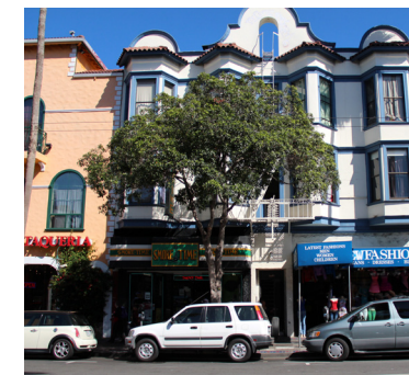
Street Tree Árbol