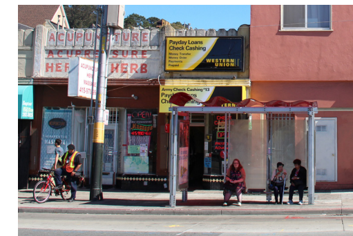
Bus Shelter Refugio de parada de autobús